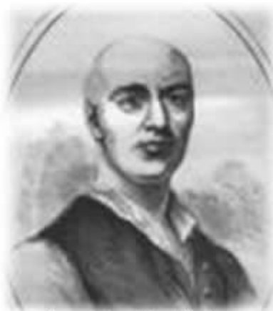
Figura 6 - Jack Johnson Broughton 7