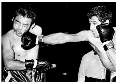
Figura 13 – Éder Jofre golpeando Rudy Corona 14

A proteção utilizada no profissional são o protetor bucal e a coquilha, lutando-se sempre com o tronco descoberto.