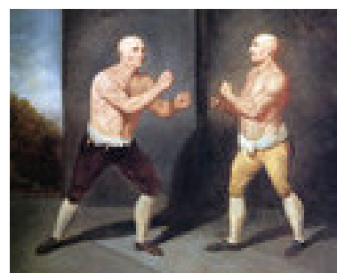
Figura 5 – A era dos punhos limpos 6