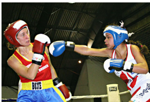
Figura 11 – Boxe feminino amador 12

No Brasil, o amadorismo feminino apresenta um grau técnico elevado, estando incluído nos jogos abertos e organizado em diversos campeonatos nacionais e estaduais.