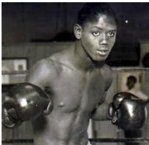
Figura 10 – Kid Chocolate 11

Apesar desta mentalidade de muitos, as condições sociais e políticas do país, fazia com que jovens buscassem no boxe profissional a subsistência em um meio de miséria e corrupção. Aproveitando estas condições, promotores do boxe profissional focavam através dos meios massivos de comunicação, a vida de boxeadores profissionais famosos para refletir em principiantes e em outros que subiam por necessidade ao ringue - sem muitas vezes ter recebido aulas de boxe e na maioria das vezes sem a experiência como amador – a ilusão do profissionalismo como um meio de ascensão social. (DOMÍNGUEZ, J.; LLANO, J. L. La preparación básica de los boxeadores . Tradução por Soltermann, L.1987, p.21)