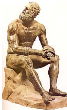
Figura 3 – Representação do “cestus” 3