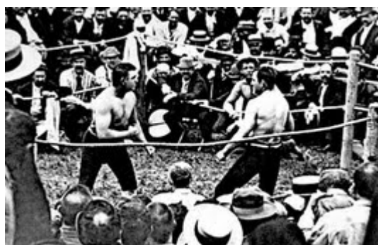
Figura 7 – Luta entre Sullivan e Killrain 8

No dia 8 de Julho de 1889 se realizou a “última” luta a punhos limpos por um título, entre Sullivan e Killrain, com o triunfo do primeiro. Sullivan que era estadunidense tornou-se um marco entre o boxe a punhos descobertos e o boxe com luvas, sendo o último campeão mundial da prática a punhos nus e o primeiro a punhos cobertos.