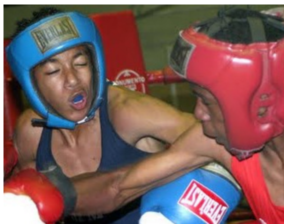
Figura 12 – Luta de Boxe Infantil 13

Nas categorias infantis, 13 e 14 anos, o combate masculino dura 3 rounds de 1 minuto e 30 segundos cada. Sendo no feminino 3 rounds de 1 minuto cada. Utilizando-se sempre as luvas de 12 oz, com o fim de evitar maiores lesões e/ou cortes nos participantes.