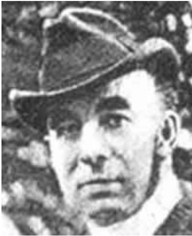
Figura 8 – John Sholto Douglas VIII Marquês de Queensberry 9