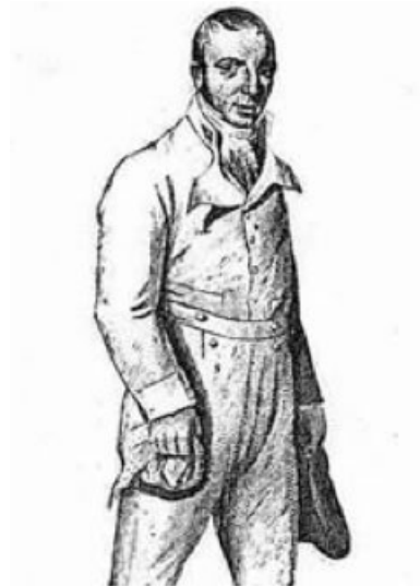
Figura 9 – John Graham Chambers 10