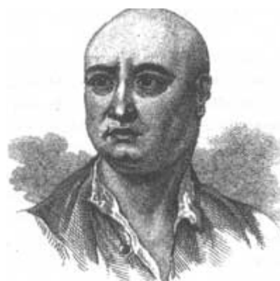
Figura 4 – James Figg 5

James Figg foi o primeiro professor a lecionar aulas de boxe para intelectuais e aristocratas em sua própria escola, sem o objetivo de formar profissionais, estas aulas tinham a pretensão de dar noções de luta para defesa pessoal em duelos e assaltos comuns à época, tornando-se para os ingleses uma nobre distração .